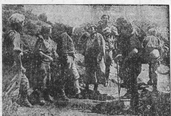
Hasta las líneas avanzadas llega frecuentemente la visita de las mujeres de Frentes y Hospitales. Van a llevar a los soldados de España el recuerdo y la prueba del amor que la retaguardia siente a los soldados que luchan por la Patria.