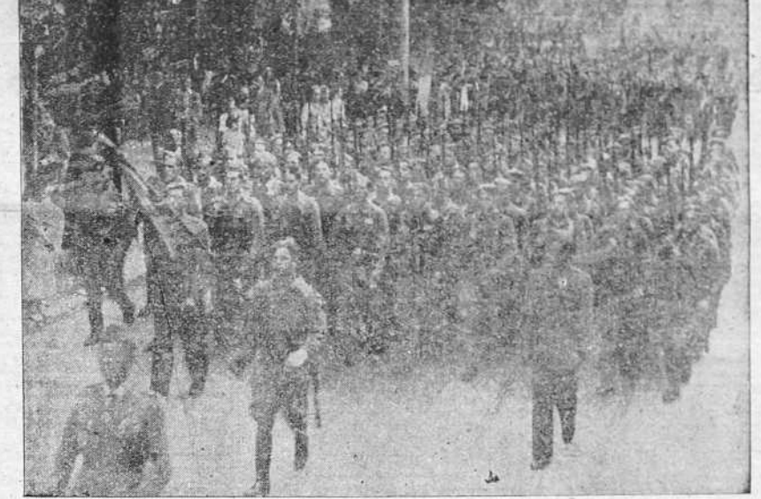
Los sargentos de Infantería, que hoy renovarían el juramento a la bandera, a su paso por el Cantón Grande en la tarde de ayer

Avenida de Fernández Latorre, Primo de Rivera, Linares Rivas, Plaza de Orense, Sánchez Bregua,