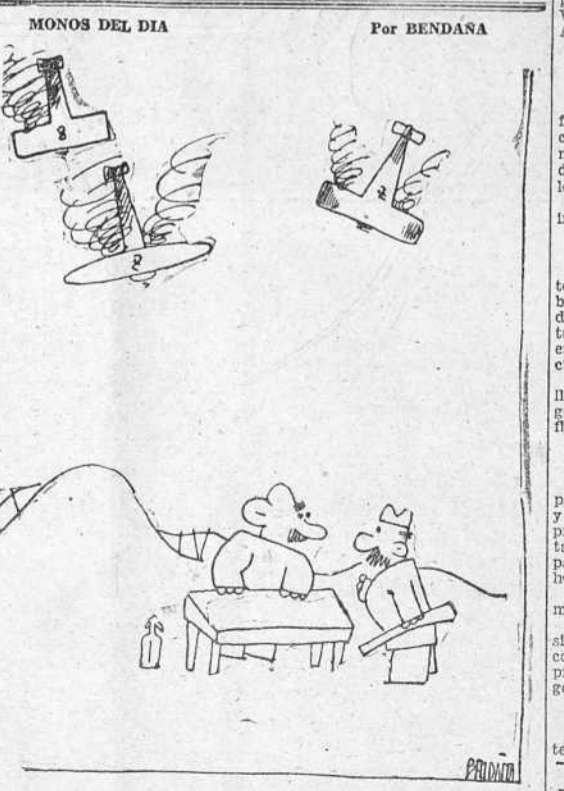
MONOS DEL DIA Por BENDANA

No os enteráis que se van incorporando a la España Nacional nuevos pueblos liberados del dominio marxista. Ayudadlos con vuestros donativos en metálico o especie y entregadlos en Real 78 a la Junta de Auxilio a Poblaciones Liberadas.