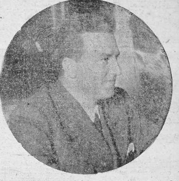
El Coronel Teijeiro, muerto gloriosamente por Dios y por España en la campaña de Asturias

Lo que hasta ahora ha venido ocurriendo es un atropello al derecho, una injuria a la ley, y una torpeza política grandísima puesto que si ciertamente buscan la paz de Europa los hombres de Estado el reconocimiento de nuestros derechos de beligerancia hubiera acortado los plazos de la guerra. Pero aquí está el secreto. Las naciones interesadas en que las armas nacionales no se apuntaran la victoria total y definitiva, las mismas potencias que dificultaron el camino del Norte y que dotaron de hombres y material al enemigo, son las que, atropellando la justicia, soslayaron el tema del reconocimiento de nuestro derecho a la beligerancia. Pero