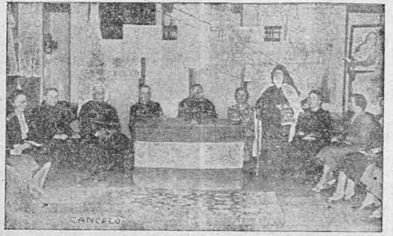
La presidencia del acto de la inauguración del Curso 1938-39 de la Juventud Femenina de A. C.

SEVILLA, 17.—El Generalísimo deseara obsequiar a los voluntarios italianos que retornan a sus lares, antes de zarpar los buques rumbo a Nápoles, encargó al general Quijeto de Llano les hicieran regalos en su nombre, habiéndoseles entregado 15.000 botellas de vino de Jerez, 10.000 cajetillas de tabaco, 30.000 medias libras de chocolate, tonelada y media de caramelos, conservas, medallones, "blocks"—cines del Caudillo y tarjetas postales. A los 385 oficiales les fueron entregadas botellas de solera de Jerez y de coñac y unas preciosas carteras de Ubrique. Los legionarios prorrumpieron