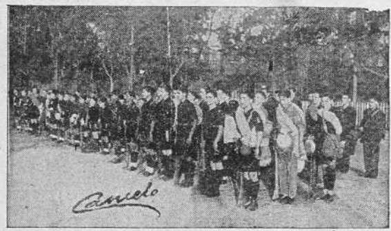
Los expedicionarios de las Organizaciones juveniles coruñesas, momentos antes de partir para la magna concentración que se celebrará en Sevilla el día 29