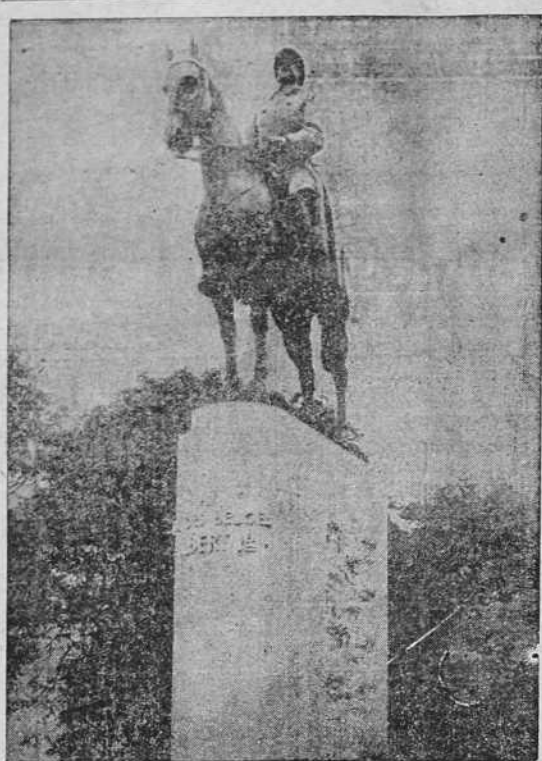
La estatua equestre del Rey Alberto en París, a cuya inauguración asistieron: el actual Soberano de Bélgica, Leopoldo III; su egregia madre, su hermano el Conde de Flandes y la Princesa de Piemonte

Una hora después el edificio se veía invadido por 500 agentes de la G. P. U. Los oficiales se defendieron con las armas, mientras los agentes de la G. P. U. intentaban