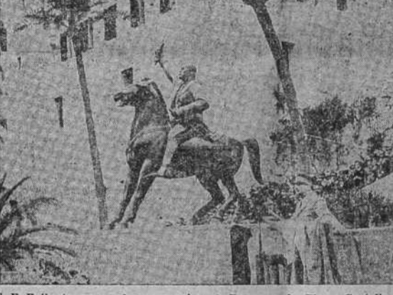
S. E. Balbo inaugura el monumento al Duce en la Plaza Castello, ante los 20.000 colonos

La Falange Española Tradicionalista de Cuba envía un obsequio a los combatientes BURGOS, 12.—La Falange Española Tradicionalista de Cuba, por medio de su jefe y del jefe del Servicio Exterior, ha hecho llegar a los combatientes españoles 150.000 cajetillas de tabaco, 10.000 puros y 6.000 libras de picadura.