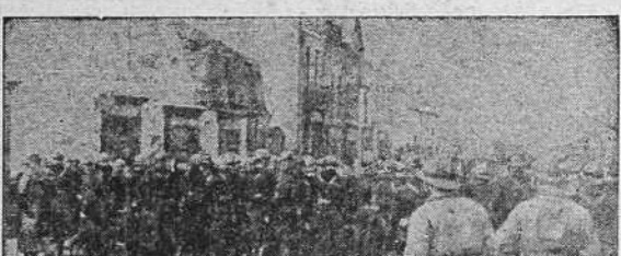
NUEVA ENTREVISTA EN EL QUAI D'ORSAY

BERLIN 7.—La "Correspondencia Política y Diplomática" escribe que la declaración franco-germana, dada ayer en París ha eliminado la posibilidad de un grave conflicto, no sólo entre Alemania y Francia, sino en toda Europa.