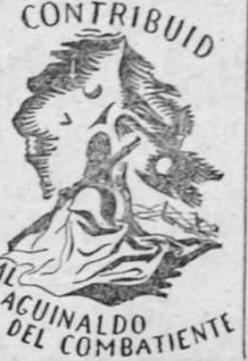
CONTRIBUIDOR AGUINALDO DEL COMBATIENTE

tudiantes desfilaron por las calles cantando y lanzando gritos hostiles contra los antifascistas extranjeros y alzando al Duce y a la Italia imperial; entre el entusiasmo de las poblaciones.—(Stéfani). TURIN, 7.—También hoy los estudiantes han improvisado manifestaciones de protesta por los incidentes de Túnez y Córcega. Los manifestantes pasaron ante el Consulado francés manteniendo un silencio absoluto. A continuación desfilaron ante el Consulado de Alemania, rindiendo un tributo de amistad entusiasta hacia dicho país. El ómnibus alemán apareció en el balcón y dirigió un saludo a los manifestantes.