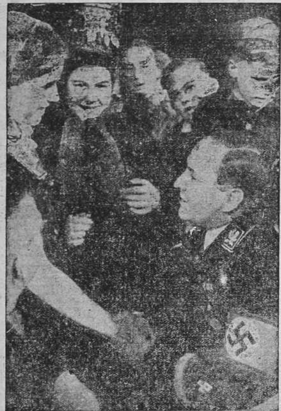
LA ASAMBLEA ANUAL DE LOS AGRICULTORES EN GOSLAB -- El ministro de Agricultura, Walter Darré, en medio de las delegaciones de la juventud campesina. Prueba de la importancia de dichas asambleas es que diecisiete naciones han mandado delegaciones