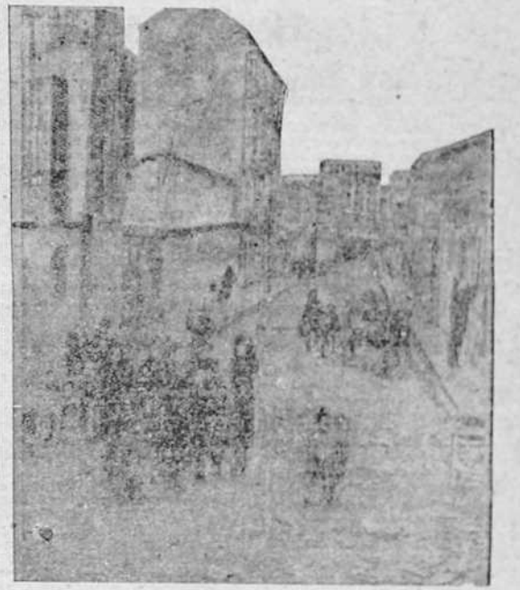
He aquí una triste escena del Madrid hambriento y tiranizado por la horda roja. Una calle de los Cuatro Caminos. Unas mujeres se disponen a iniciar una de las infinitas colas que son el espectáculo diario de la ciudad, mientras en unos corrillos unos vecinos cargan unos muebles. ¿Para huir del infierno rojo hacia algún pueblo de los alrededores? ¿O se trata del despojo de algún "franquista" asesinado la noche anterior?

—El Generalísimo, terminó diciendo el señor Ministro del Interior, no pudo visitar La Coruña con motivo de ser su viaje absolutamente de incógnito. La Coruña, una de las ciudades más acogedoras y simpáticas de España, de adhesión inquebrantable al Movimiento nacional, le hubiera tributado sin duda un recibimiento que hubiera sobrepasado todos los cálculos.—LOGOS.