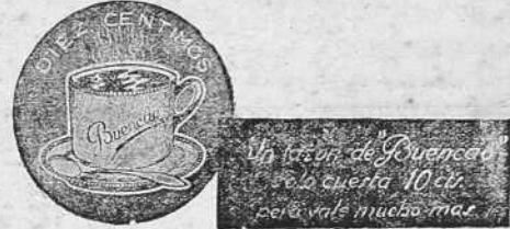
Un rasgo de "Buen gusto" sobre una taza.

NI ALABANZAS NI INIURIAS SOLO LA VERDAD EN "HAZ"