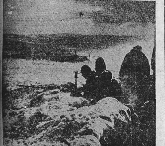
Un puesto avanzado en el frente

El "homo loquax" es una nueva especie humana, estudiada filosóficamente por Bergson.