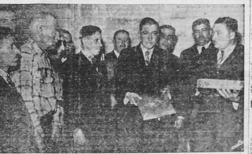
El señor Oliveira Salazar acaba de ser objeto de un homenaje que le rindieron los 312 Sindicatos Nacionales existentes en Portugal.—La Comisión organizadora le entrega un pergamino con las firmas de los representantes de todos las Agrupaciones sindicales.

La compañía Lufthansa declaró que seguramente se trata de un avión que desapareció en octubre pasado, con diez pasajeros y dos tripulantes.