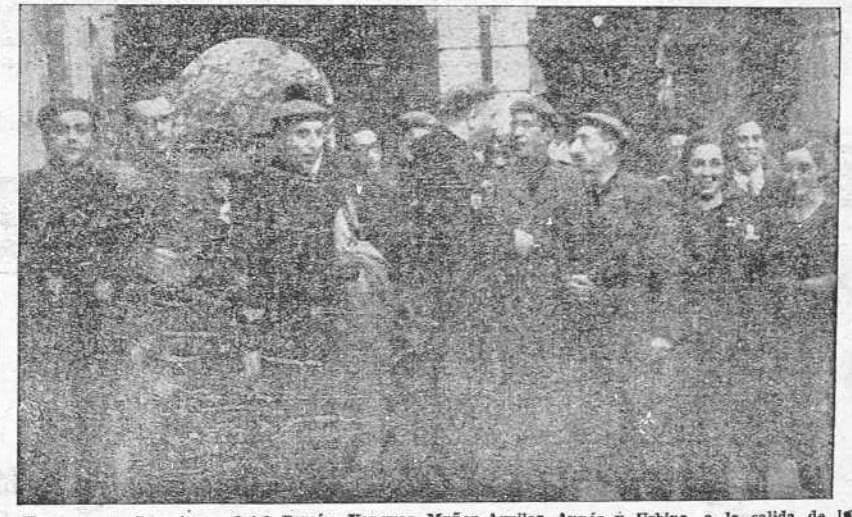
Un grupo de Consejeros: Oriol Pemán, Yanguas, Muñoz Aguilera, Aunós y Urbina, a la salida de la reunión del Consejo Nacional de Falange Española Tradicionalista.