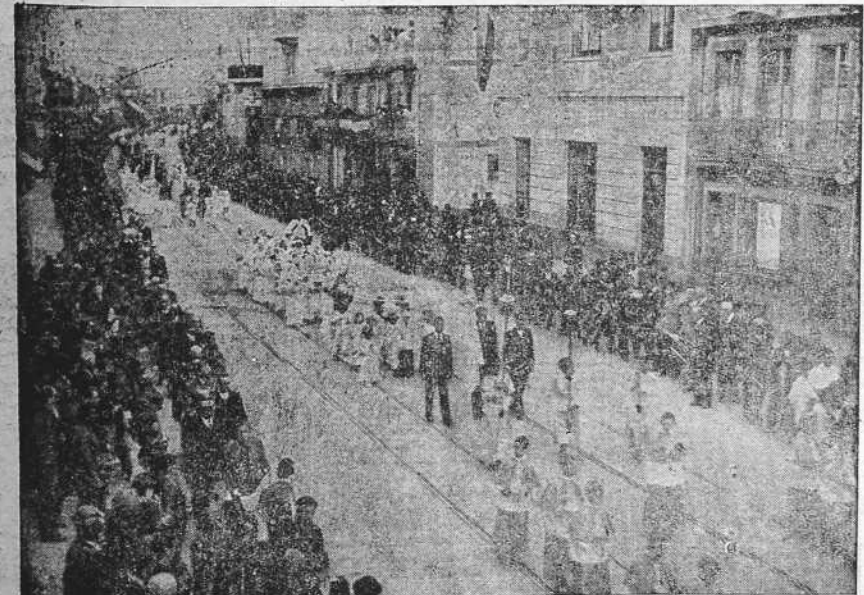
Aspecto de la procesión del Corpus al desfilar ayer tarde por la calle de San Andrés (Foto EL IDEAL GALLEGU).