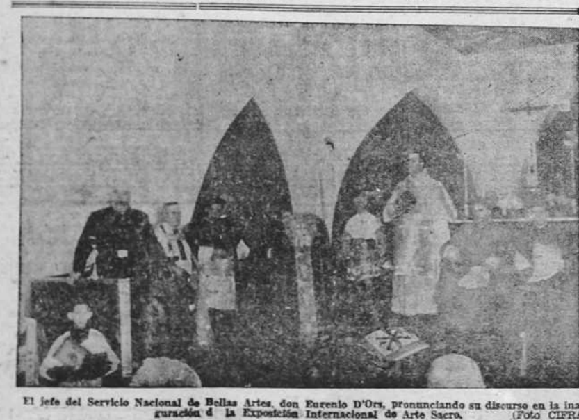
El jefe del Servicio Nacional de Bellas Artes, don Eusebio D'Ors, pronunciando su discurso en la inauguración de la Exposición Internacional de Arte Sacro.

A las once de la mañana, Oza (2 puntos) contra Cambre (1 punto). A las 3 y media de la tarde, Deportivo Gaitera (8 puntos) contra Orensanes Juveniles (8 puntos).