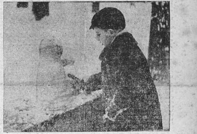
Sobre Madrid ha caído una intensa nevada, una de las mayores registradas desde hace veinte años. En el Retiro, uno de los niños que encontraron en la nieve el mejor regalo para sus juegos.