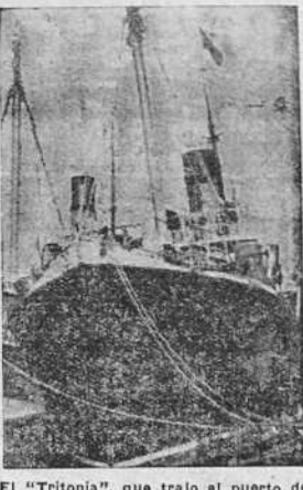
El "Tritonia", que trajo al puerto de La Coruña varios naufragos de un barco hundido en el Atlántico