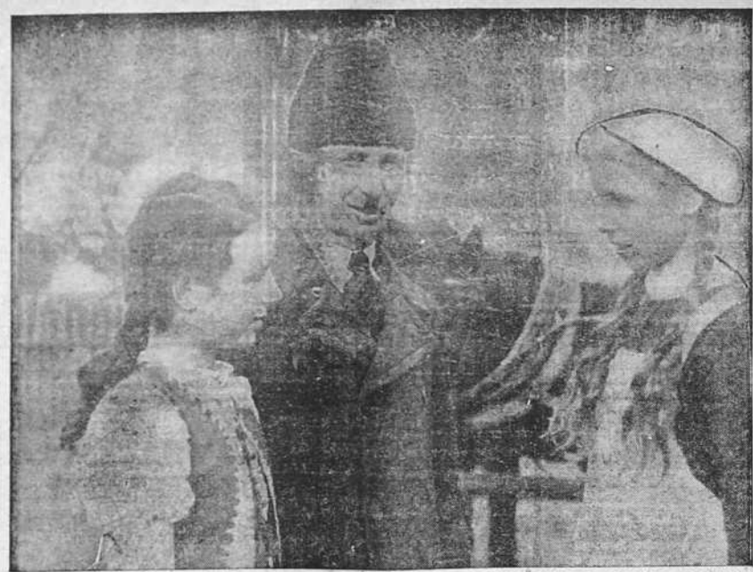
LA REINCORPORACION AL REICH DE LOS ALEMANES RESIDENTES EN LOS PAISES BALTICOS.—Un campesino de origen alemán que hasta ahora residía en Letonia se traslada con sus hijas a la provincia de Posen.

Conversión y suscripción pública de 73.130 obligaciones hipotecarias de 500 pesetas. AL 5 POR 100 DE INTERES Tipo de emisión 97 por 100, o sea 485 pesetas por obligación. Los actuales obligacionistas que opten por la conversión, recibirán las 15 pesetas de prima y la diferencia de interés hasta el 29 de febrero. Asegurada la emisión por: BANCO DE BILBAO, BANCO CENTRAL, BANCO DE SANTANDER que la ofrecen en sus oficinas centrales y en todas sus sucursales y agencias. DEL 20 AL 29 DEL ACTUAL