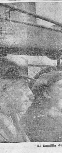
El Caudillo durante su visita a las minas y destilerías de Puertollano (Foto CIFRA).

El número de matrimonios celebrados en las 98 provincias fué de 27.319. Los nacidos en dicho mes suman 92.982 y los muertos son 65.854. El excedente de los que nacieron sobre los que murieron es de 27.128. En 31 de enero de 1940 los habitantes residentes en el suman 44.557.000.