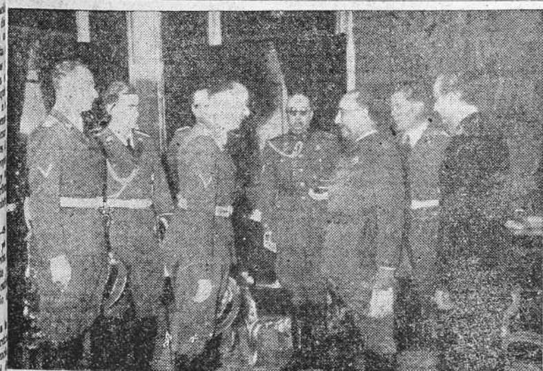
Reichsführer de la S. S., Heinrich Himmler, fué recibido en El Pardo por el Jefe del Estado español, Generalísimo Franco, a quien acompañaban el Ministro de Relaciones Exteriores, señor Serrano Súñer, y el general Moscardó, jefe de la Casa Militar de S. E.

Un periódico de Estocolmo informa que las mujeres, los niños y los ancianos de Londres continúan haciendo cola, desde las primeras horas de la mañana, ante los refugios, para conseguir un rincón donde dormir por la noche. Se ha anunciado la próxima aplicación del sistema de tarjetas de entrada para los refugios públicos. Los interesados recibirán una tarjeta mensualmente. Este plan ha sido aplicado ya para ciertos refugios aislados. Las estaciones del "Metro" refugios para la población necesitada quedarán excluidos del régimen de tarjetas.—(EFE).