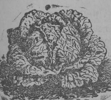
Lechuga de Repollo

Planchas para repujado, estaño, plata, latón y cobre útiles para sus trabajos; patines colores; pedrería. Pirograbado y sus útiles.