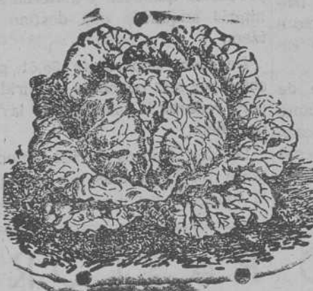
Lechuga de Repollo

Las artes aplicadas a la decoración del hogar