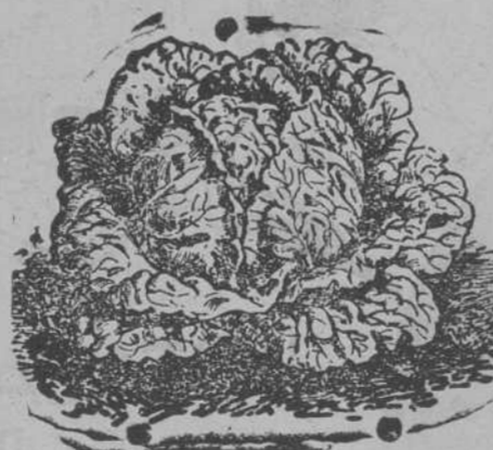
Lechuga de Repollo

Semillas de todas clases: hortalizas, forrajeras, y flores.