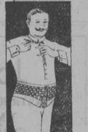
FAJAS DE CARALLERO

PIERNAS ARTIFICIALES por tendones compensadores.—CORSES ORTOPEDICOS para desviaciones, mal de Pott.—Aparatos para PIERNAS y PIES TORCIDOS, TUMORES BLANCOS, PARALISIS FAJAS para vientres abultados, estómago y riñón caído, etc.