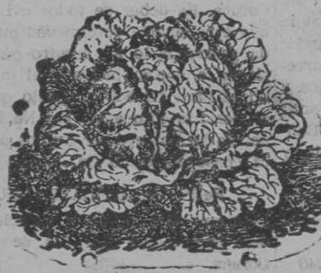
Lechuga de Repollo

Remolachas variadas; guisantes y judías. Tubérculos de flores variadas, gran surtido