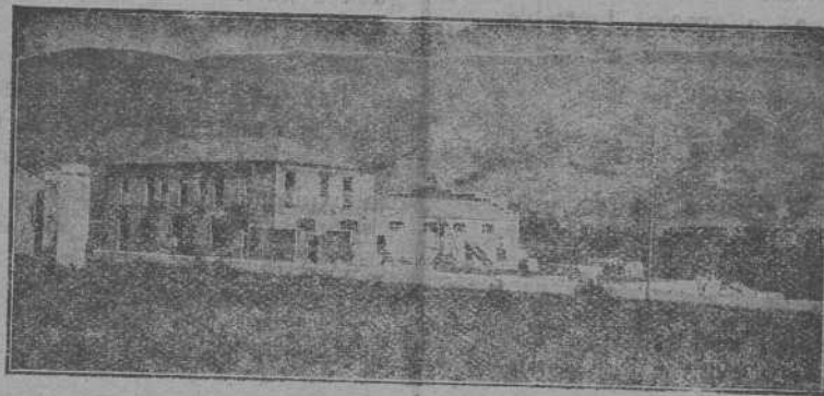
Vista de la Fábrica a la carretera de Ponferrada a Orense

Inmejorable teja plana y curva patentada.—Cubrerías y remates.—Escrupulosidad en la fabricación de mosaicos lisos y en colores, comprimidos a 200 atmósferas de presión, con prensas hidráulicas y eléctricas.—Bloques para muros.—Ladrillos de escoria. Variedad en ménsulas, jarrones y balastradas etc.—Fregaderas, piletas, peldaños y toda clase de trabajos relacionados a mármoles comprimidos.—Tuberías con enchufe, para conducción de aguas, con, y sin presión.—Altas calidades y precios económicos. Para contratistas y almacenistas, precios especiales.