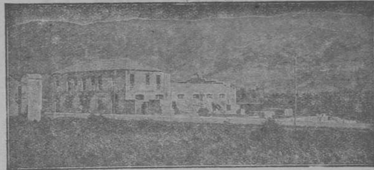
Vista de la Fábrica a la carretera de Ponferrada a Orense

FABRICA DE PRODUCTOS DE CEMENTO PORTLAND RUA PETIN (Orense) TELEFONO Núm. 25