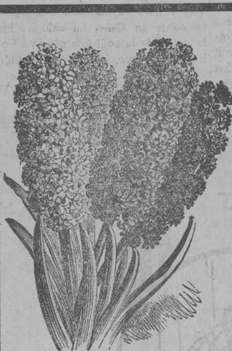
Jacintos dobles de Holanda

JOSÉ BLANCO VEGA :: Plaza del Hero, núm. 1 (soportales)