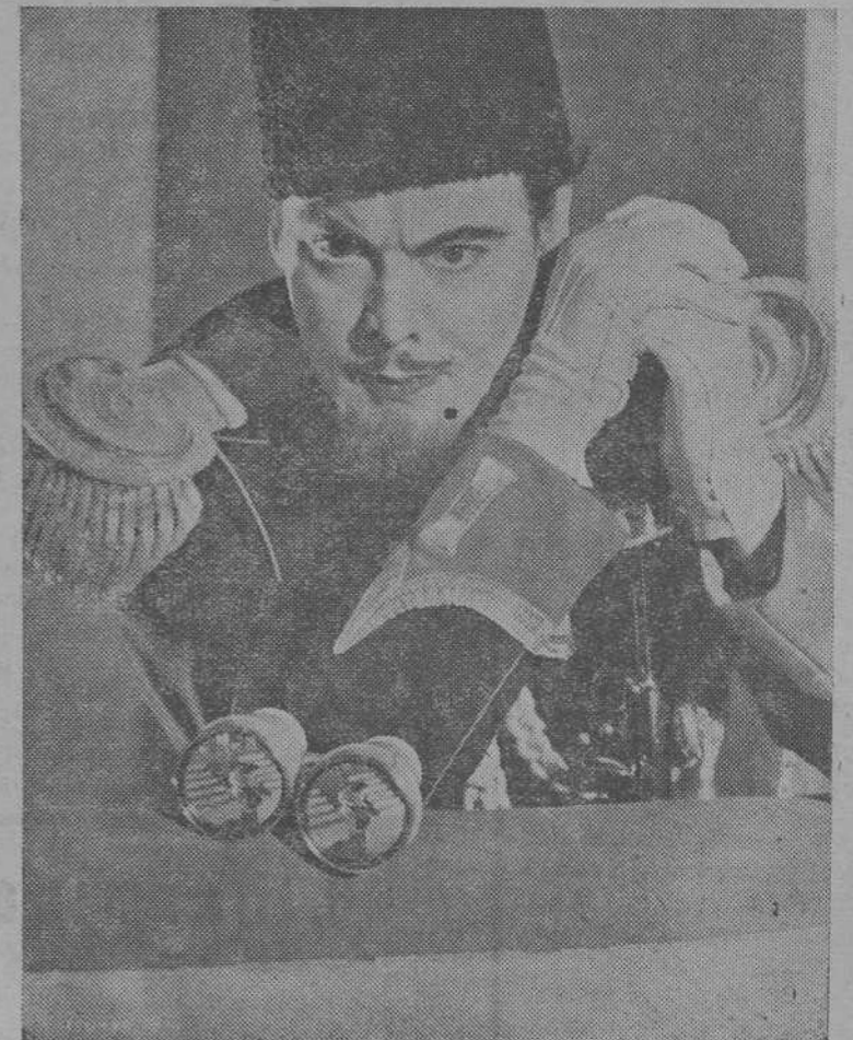
Nils Asther, famoso galán e intérprete de uno de los más importantes «roles» de la película titulada «Abdul Hamid» (El Sultán maldito), que distribuyó Cifesa.