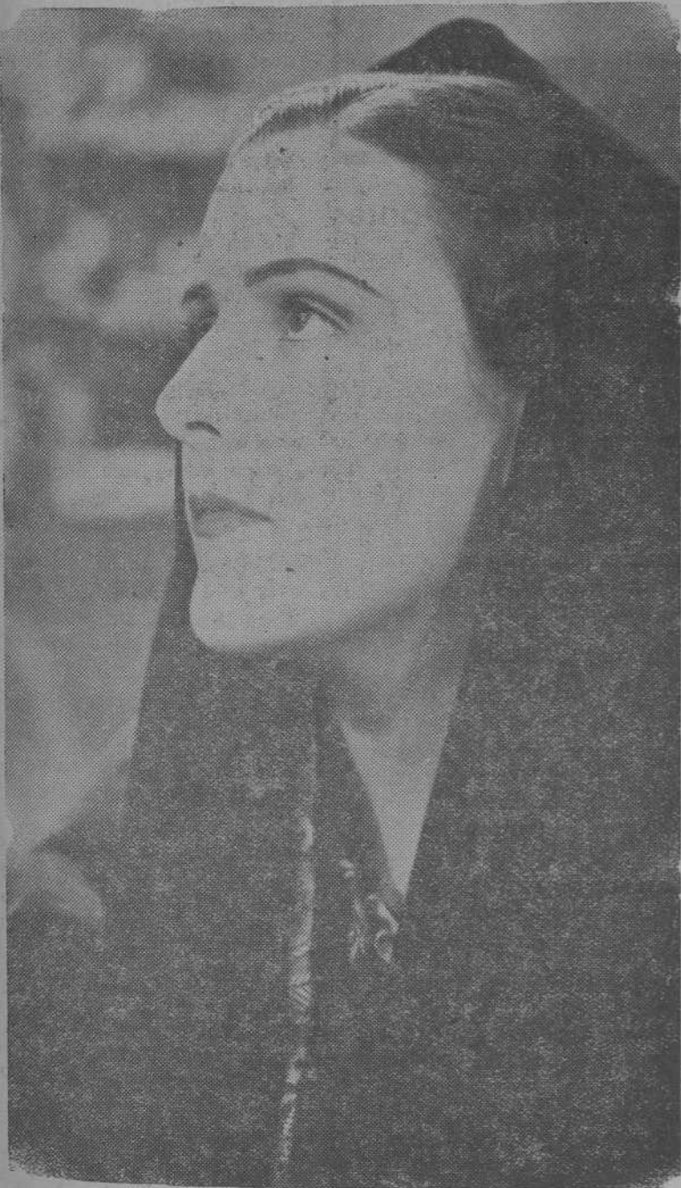
La primera «estrella» española Imperio Argentina, protagonista de la superproducción nacional de Cifesa «Nobleza Baturra»