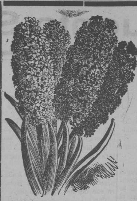
Jacintos dobles de Holanda

La primera al empezar el movimiento de la savia, en últimos de Febrero o principios de Marzo, pero siempre antes de que las yemas se hayan desarrollado; la segunda en plena actividad de la circulación, desde Abril a Mayo; el ter-