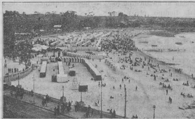
Montevideo. Playa Ramirez