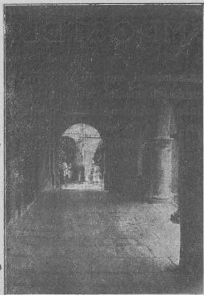
Santiago. — Una típica rúa de la ciudad

copiosa tirada de fascículos en los que sintéticamente se reseña la ciudad compostelana y se informa de modo sucinto al lector acer-