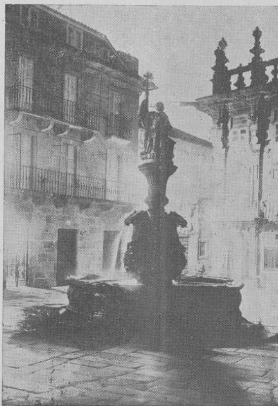
Santiago. - La fuente de las Platerías

Es plausible la labor divulgatoria que en favor de Compostela ha iniciado el Patronato Nacional del Turismo, mediante una