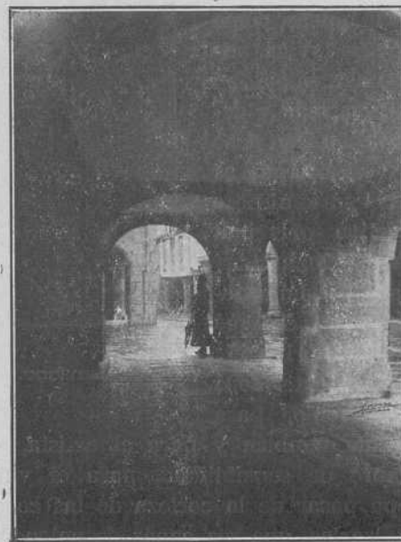
Santiago. — Soportales de la Rúa Nueva

»Entre las agregadas, las más bellas son las de San Fernando y la de las Reliquias. Esta última es obra de Juan de Alava (1523) y hállanse en ella los sepulcros yacentes del conde Raimundo de Borgoña, de Fernando II, Alfonso IX, Emperatriz Doña Berenguela, es-