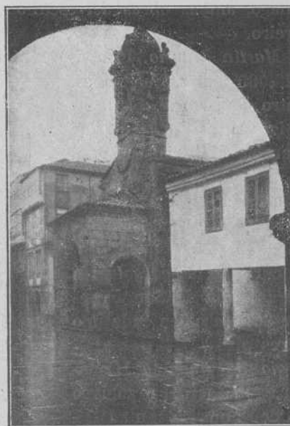
Santiago. - Un aspecto de la iglesia de Santa María Salomé

cio de Gelmírez, magnífico modelo de arquitectura románica civil, de amplias salas, con riquísima ornamentación en los capiteles de