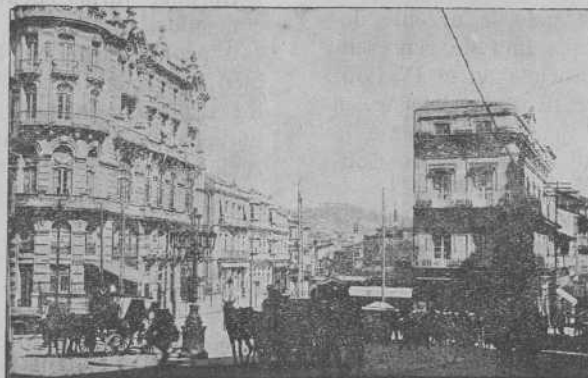
La Puerta del Sol en Vigo