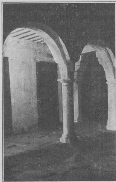
Santiago. - Uno de sus típicos porches

miento, con elementos ojivales, es de Juan de Alava.