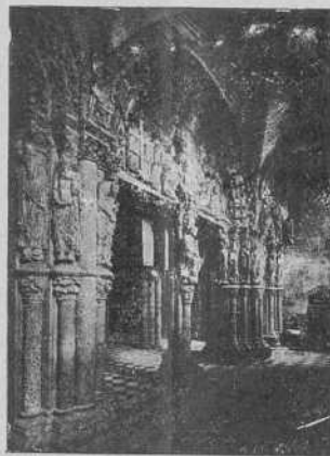
Santiago. — El famoso Pórtico de la Gloria.

» Excursiones. —Pueden hacerse agradabilísimas excursiones por el valle del Ulla, en el que se hallan espléndidas mansiones señoriales (Oca, Linares, Ribadulla), a Padrón donde surge la leyenda jacobea, a Noya y a otros lugares de Galicia.»