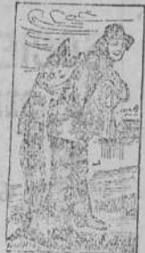
Marca de fábrica.

Exíjase la legítima que lleva adherida á la cubierta la contramarca del hombre con el bacalao á cuestas. De venta en las Boticas. El mercado está lleno de imitaciones. Rechacense. Scott y Bowne, Químicos, Nueva York.