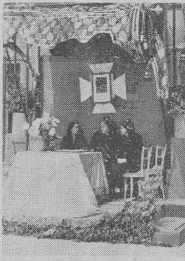
Mesa petitoria instalada por las Mujeres de Acción Católica en el Cantón Grande (La Coruña).