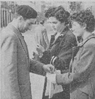
Señoritas postulando en la vía pública