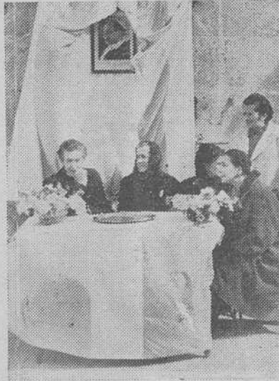
Tres aspectos de la postulación callejera en La Coruña