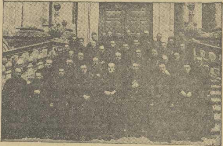
Sacerdotes de la Diócesis que asistieron al Cursillo para Directores de Ejercicios Espirituales que se celebró en el salón de actos del Seminario Conciliar entre los días 21 y 24 de agosto.