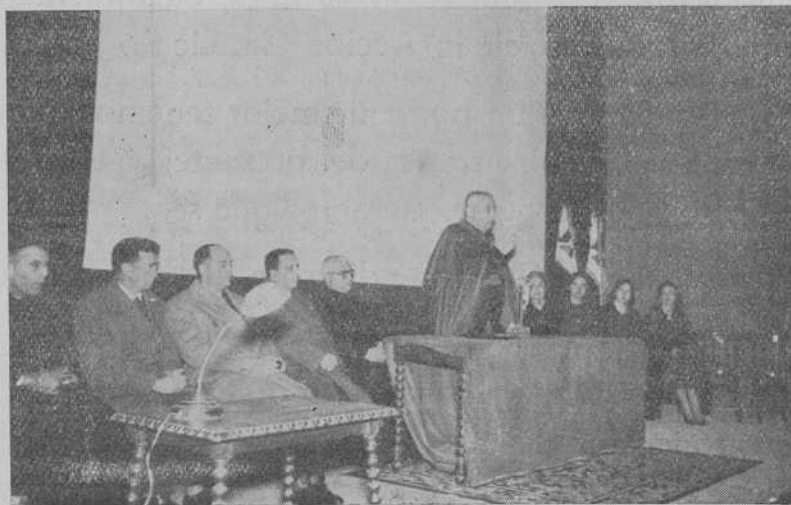
El Emmo. Sr. Cardenal Arzobispo pronuncia el discurso de clausura