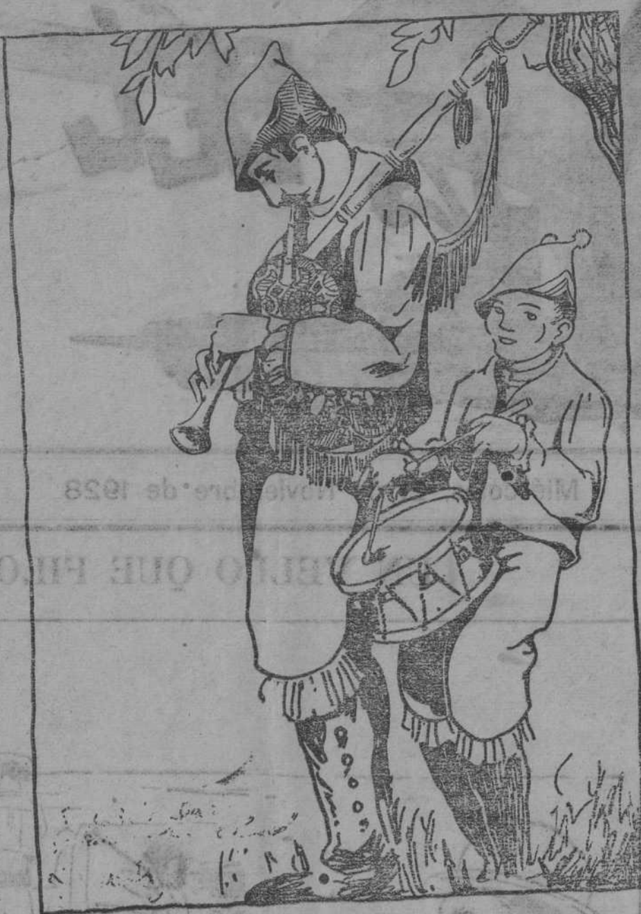
O tamborileiro. -- Meu pai sopra milloir n'as cuncas d'o viño novo que na gaita.