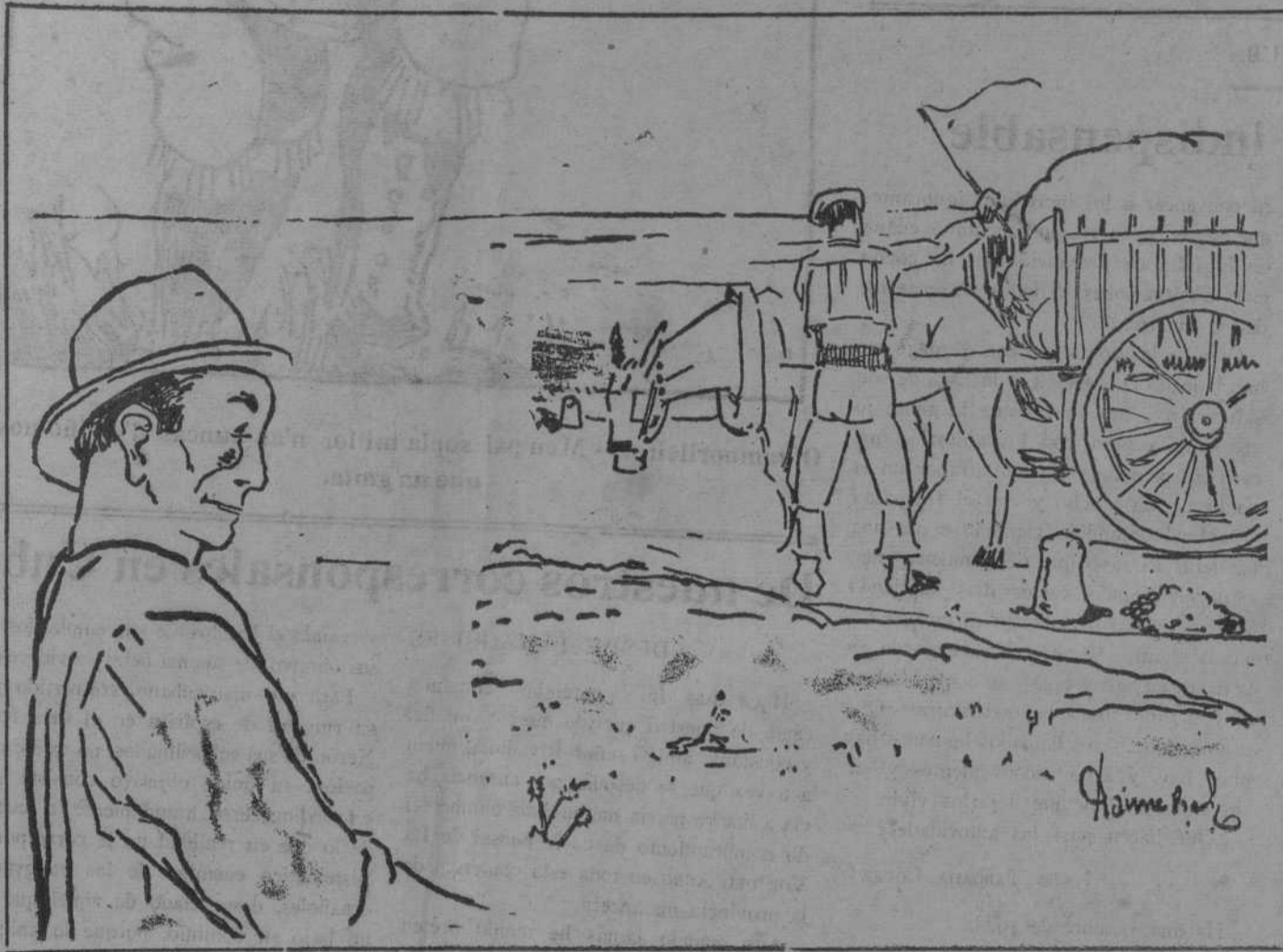
Hay bestas que son menos animales que a xente.