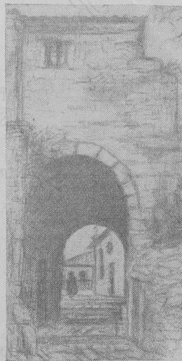
Tuy.- Pasadizo de la Misericordia (Dibujo de E. Padín)

Así, pues, acariciamos la esperanza —nuestro optimismo está fabricado a prueba de bombas de cobalto— de que el próximo Boletín cuente con mayor número de páginas, esta vez reservadas para las actividades del Instituto Laboral, Cámara de Comercio y Servicios de Extensión Agrícola, y se establezca una noble pugna entre ellas y las propias del Boletín, para exaltar y estimular todo lo bueno y señalar y censurar todo lo malo, sin partidismos ni desmayos.