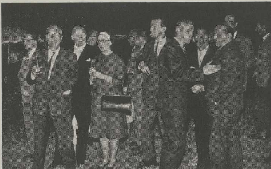
TUA.-un grupo de los directores de Agencias de Viajes, presenciando en el Club Náutico la actuación del conjunto típico de baile "Froles Mareliñas".

Agradecemos al Sr. Gobernador Civil y al Delegado Provincial de Información y Turismo su marcado interés por dar a conocer los atractivos turísticos de Túa, esperando que en fecha muy próxima la visita de las referidas personalidades contribuya a un mayor incremento de las corrientes turísticas hacia Túa.