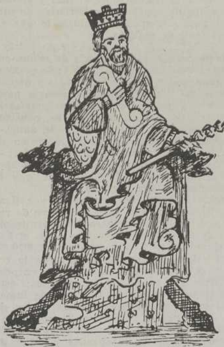
Alfonso VI, Miniatura del Tumbo A de la Catedral de Santiago.

Hay noticias de que D. Alfonso no quería ir, por lo menos abiertamente, contra lo dispuesto por su padre, limitándose a dejar pasar por su reino las tropas de D. Sancho, a cambio de la entrega de la mitad de sus conquistas. Existen pruebas de que el despojo y reparto de Galicia, entre ambos, estaba consumado en mayo de 1071.