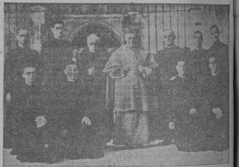
CUENCA.—El Arzobispo de Sevilla, Cardenal Segura, y el Arzobispo dimisionario de Lima con los ocho jóvenes misioneros Paules, a quienes impusieron los crucifijos antes de marchar en misión evangelizadora a Filipinas. (Foto CIFRA.)

(Word copyright by United Features Syndicate Derechos exclusivos para su publicación en España, adquiridos por la Agencia EFE. Prohibida la reproducción.)