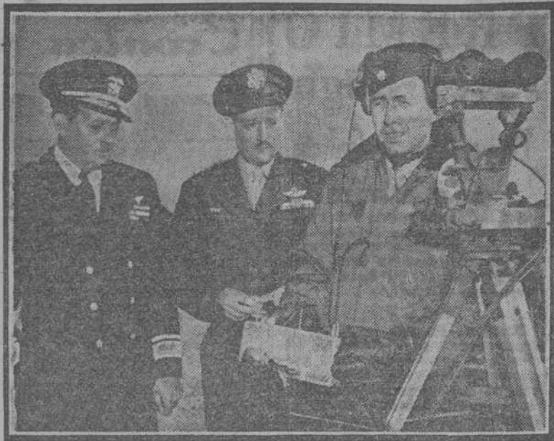
Desde el puesto de mando fueron controlados aviones sin piloto. Uno de los oficiales que aparecen en la foto, maneja los aparatos destinados a dirigir los aeroplanos que fueron sometidos a la prueba de la nube atómica

La Cofradía alauita expresa la adhesión marroquí al Caudillo