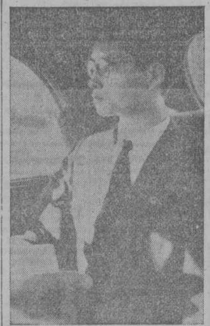
El nuevo Rey de Siam, Fumiño Adundet, hermano de Ananda Maydol, asesinado en su patria, a su llegada a Suiza donde va a estudiar en una Universidad.