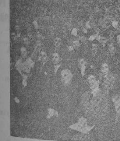
BUENOS AIRES.—Un aspecto de la concurrencia al Congreso de la Juventud Católica, con asistencia de los representantes del Brasil, Chile y Perú.

CONGRESO DE LA JUVENTUD CATOLICA DE LA ARGENTINA