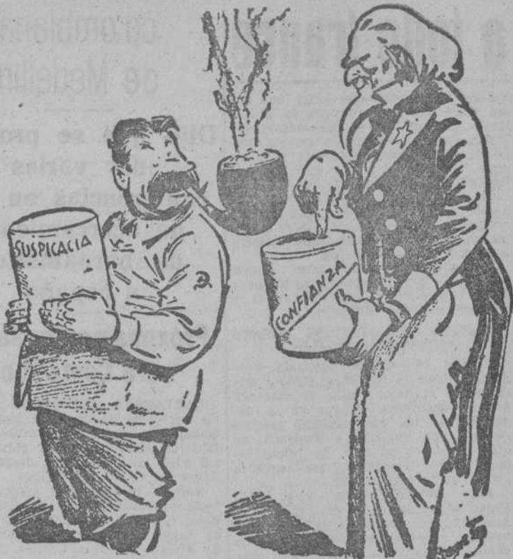
¿Qué le parece si mezcláramos esto?