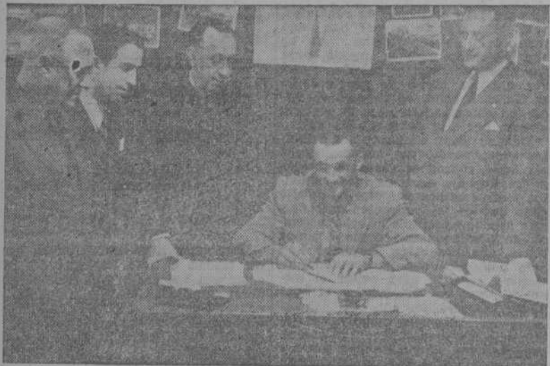
Cabido pone su firma en la ficha deportivista

Ayer obsequió la Junta Directiva a los jugadores con un refrigerio Chao, nuevo capitán del equipo