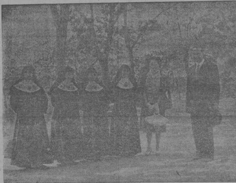
El Ministro de la Gobernación, don Blas Pérez González, Presidente del Patronato Nacional de las Hurdes, visita en Las Mestas el Hospital y Asilo de Anianos, recientemente organizado por él, en el corazón de las Hurdes