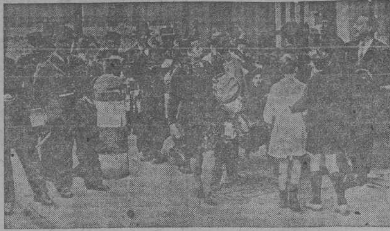
Durante la reciente huelga de aduaneros franceses, se registraron escenas tan pintorescas como la que recoge la foto, en la frontera franco-belga. Ante la indiferencia de los guardias fronterizos, hombres y mujeres pasan la línea divisoria, llevando toda clase de paquetes, sabiendo de antemano que no habían de serles registrados.