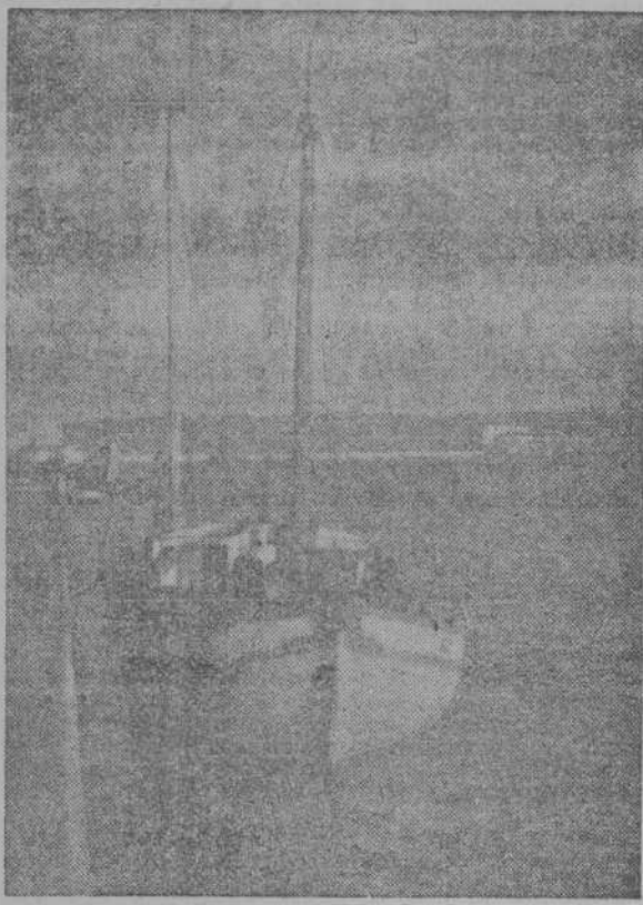
El yate "Elvi"

Se encuentra en nuestro puerto el yate sueco, de 18 toneladas "Elvi", mandado por el capitán Westmeijer. Dicha embarcación es un pequeño mundo internacional, en el que viajan 18 personas, de distintas nacionalidades, la mayoría de ellos originarios de los Países Bálticos, de los que huyeron cuando la ocupación soviética. Estos fugitivos encontraron apoyo en amigos residentes en Suecia, y en este país han permanecido dos años, pero en vista de que la situación de desplazados se prolongaba, quinientos de ellos adquirieron un yate, reuniendo sus ahorros, y se hicieron a la mar, con ánimo de dirigirse a Africa del Sur, para establecerse allí como colonos. Esta decisión está motivada por una invitación en tal sentido hecha por el mariscal Smuts, ofreciendo terrenos en la Colonia de El Cabo a ciudadanos desplazados de Europa. Como entre los huídos de Estonia, Letonia y Lituania había labradores y técnicos agrícolas, éstos son los que dispusieron la expedición, que