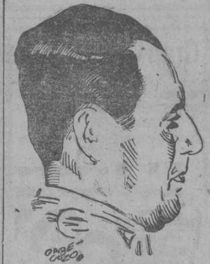
General Perón, Presidente de la República Argentina