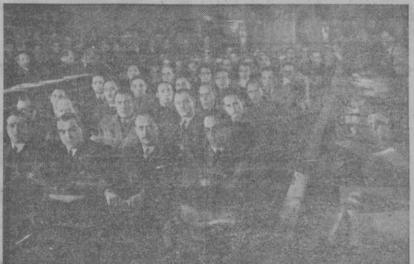
Una vista del salón de sesiones del antiguo Senado durante la inauguración del I Congreso Nacional de trabajadores españoles. (Foto CIFRA).

originales de trabajadores en lo referente a la participación en los beneficios. Durante su discurso alude a la presencia en el salón del lustre sociólogo don Severino Aznar, que es aplaudido y obligado a saludar. La presidencia pone a votación la conclusión primera que establece con carácter general, la obligatoriedad de las empresas de considerar a sus productores como participantes en razón directa con los beneficios obtenidos en cada ejercicio. Se aprueba. Se discuten varias conclusiones relacionadas con el acceso a la propiedad empresa y accionariado. Intervienen varios congresistas y se aprueban las conclusiones. También se discute sobre la reglamentación del trabajo en la pesca. Finalmente un congresista pide a todos que se dirija un saludo a todos los trabajadores del mundo. Otro se sumó a esta idea pero condicionando este saludo a todos aquellos trabajadores que comprenden la posición honrada y digna de los trabajadores españoles. Se tomaron ambas en consideración y serán discutidas.—(CIFRA).