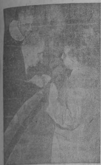
ROMA.—El escritor español D. Eugenio D'Ors que asiste al Congreso Internacional de Filosofía, en la capital italiana, aparece en la fotografía en una de las sesiones de dicho Congreso.

Molotof pide, en cambio, que Estados Unidos dé a conocer el número de bombas atómicas que posee