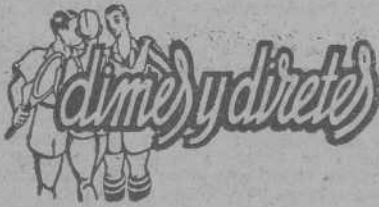
EL DEPORTIVO-CELTA A BENEFICIO DEL CLUB

Pese a la posible merma de taquilla que la actuación del equipo extranjero en Vigo, pudiera deparar al club local, los directivos coruñeses han puesto decidido empeño en no privar a La Coruña de tal acontecimiento futbolístico, y así está acordado por la F. E. F. que, caso de celebrarse el encuentro de Balaidos—no concertado en firme—habría que adelantar la fecha del 26 de enero para otra también festiva, y de no actuar las huestes de Zubietta más que en el Estadio de Riazor se mantendría aquella.