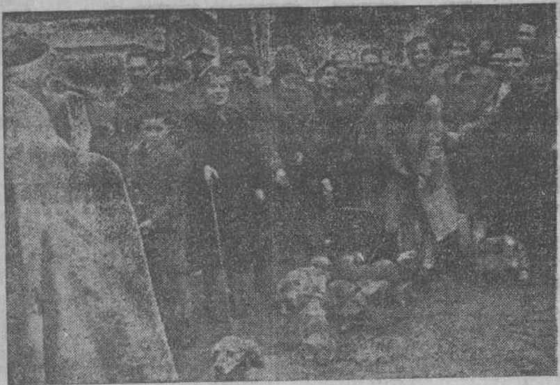
Con motivo de la festividad de San Antonio Abad, la Sociedad Protectora de Animales, celebró ayer un concurso de perros ante el pórtico del antiguo convento de San Francisco, siendo los chuchos bendecidos y a continuación premiados los mejores ejemplares presentados a dicho concurso