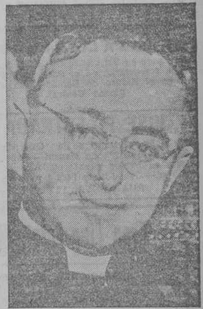
QUEBEC (CANADA), 17.—El Cardenal Villeneuve, Arzobispo de Quebec, ha fallecido a los 63 años de edad.