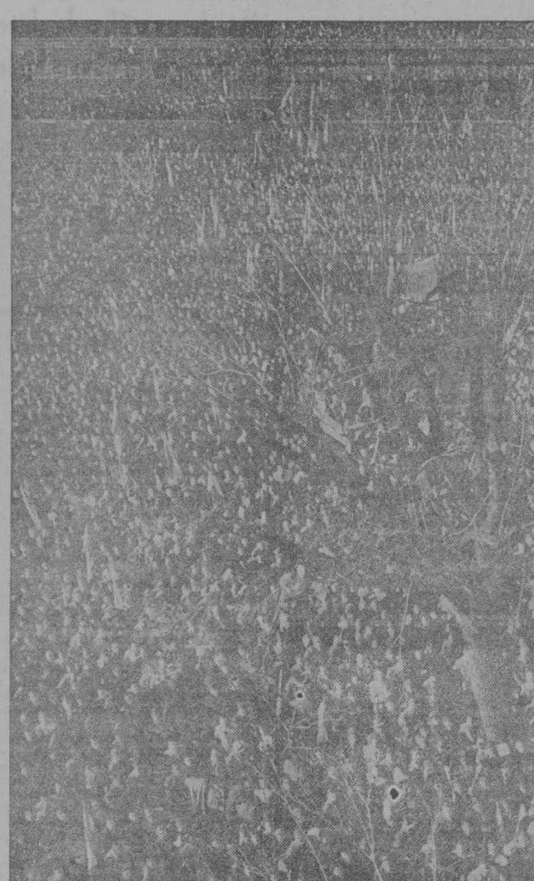
MADRID.—Una muchedumbre de varios millares de personas aclama al nuevo Embajador argentino en Madrid, don Pedro Radio a su llegada a la estación de Atocha.