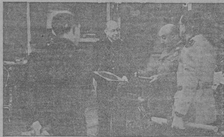
MADRID.—S. E. el Jefe del Estado recibe en el Palacio de El Pardo a una comisión del Ayuntamiento de Ayora, presidida por el gobernador civil de Valencia, quien hizo entrega de la Medalla de Oro de la Villa