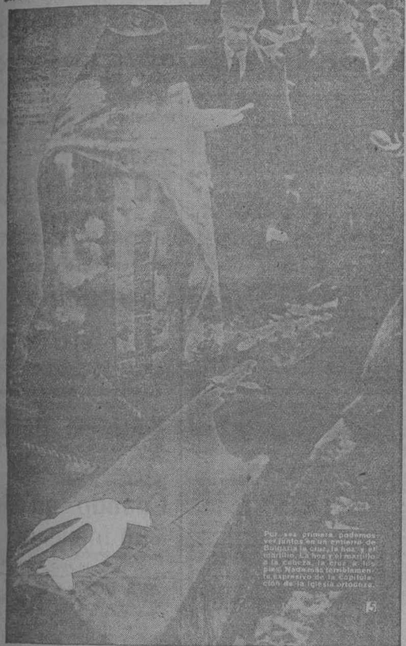
Por vez primera podemos ver juntos un entierro de Bulgaria la cruz, la hoz y el martillo y la cabeza, la cruz y los pies. Hacemos tristemente el represento de la coexistencia de la Iglesia ortodoxa.

Por primera vez en la vida, un ataud me ha hecho pensar en algo distinto de la muerte. Distinto, pero inmensamente más triste. El último número de la revista "Catolicismo" publica la fotografía de un entierro en Bulgaria, recogiendo el momento en que un sacerdote de la Iglesia ortodoxa incienso