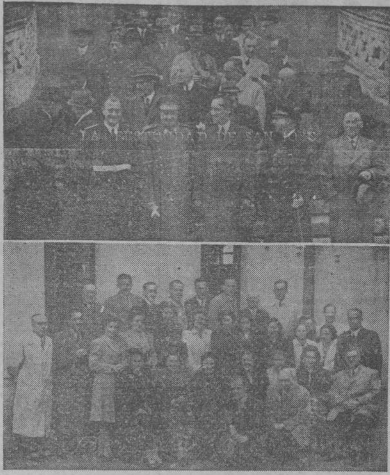
Arriba: Las autoridades y representaciones que asistieron al acto organizado por la Delegación del Trabajo en honor de su Patrono, al salir de la Iglesia de Santa Lucía. Abajo: Ingenieros y peritos industriales, acompañados de sus familias, después de haber conmemorado la fiesta de su Patrono con una misa solemne en la capilla de los PP. Capuchinos.