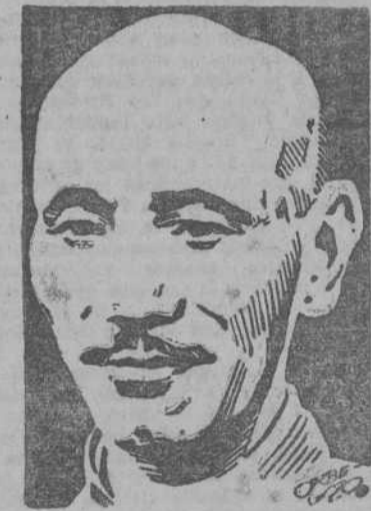
El mariscal Chiang-Kai-Chek, generalísimo de las fuerzas gubernamentales chinas.

NANKIN, 19.—EL MINISTERIO DE INFORMACION CHINO, CONFIRMA EN UN COMUNICADO ESPECIAL LA