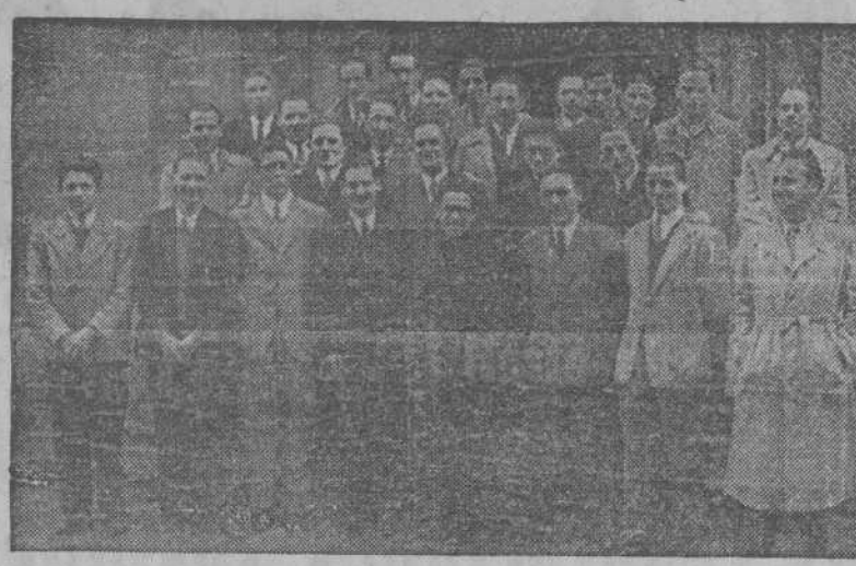
Afilados al Centro Especializado Obrero de San José de A. C., saliendo de la Iglesia de San Andrés, donde tuvieron lugar diversos actos religiosos, solemnizando la fiesta de su Patrono

Misa rezada y reparto de premios a la natalidad También los ingenieros y peritos Industriales tuvieron un acto religioso