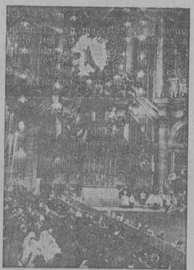
Un momento de la solemne beatificación, en la Basílica de San Pedro, de Sor María Teresa de Soubirón. (Foto CIFRA).

fenderse. En su propia patria también alres revolucionarios importaron la Ley autorizando el divorcio y la supresión del Crucifijo en las escuelas. En el bienio 1895-97, Ferrini ocupó el cargo de concejal en el Municipio de Milán, con tan brillante y valiente actuación, que sus mismos adversarios quedaron cautivados de su probidad y denpudo.