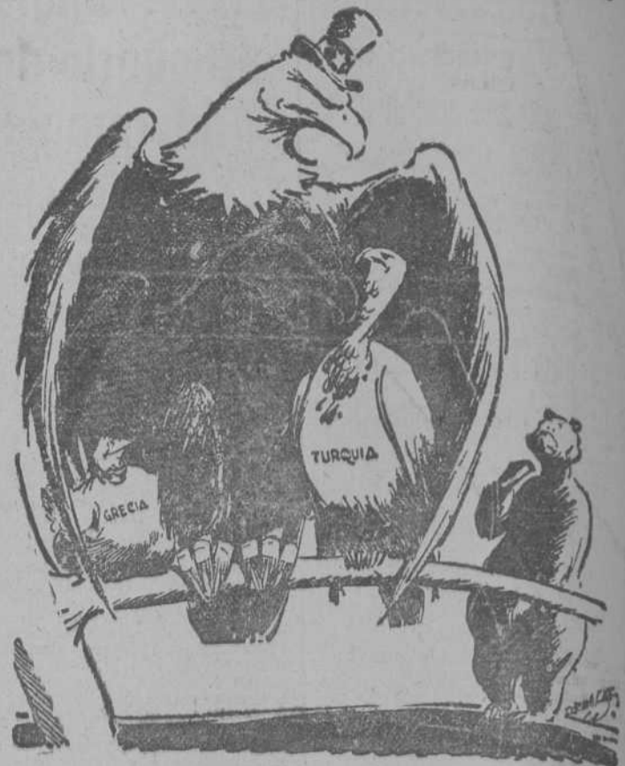
La Única con Suficiente Envergadura de Alas