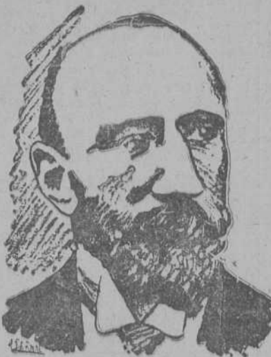
estudiantil y su magisterio, no menos notable fué su actuación política al servicio de los intereses de Dios y de la Iglesia. Cuando estaba pensoñado en Alemania, ayudó a los católicos alemanes, perseguidos, a de-