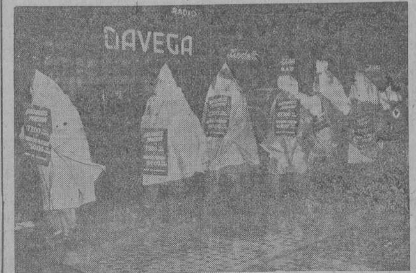
NUEVA YORK.—A pesar de la lluvia, estos obreros telefonistas en huelja continúan su "piqueteo" provistos de estos impermeables "totales" que les dan un extraño aspecto que recuerda un desfile del Ku-Klux-Klan.