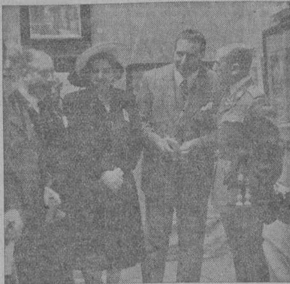
MADRID.—El ministro de Asuntos Exteriores, señor Martín Artajo, con el embajador de Portugal, señor Carneiro Pacheco, y otras ilustres personalidades extranjeras y españolas, durante el acto de inauguración, en el Palacio de Santa Cruz, de la Exposición Internacional de Acuarelistas.