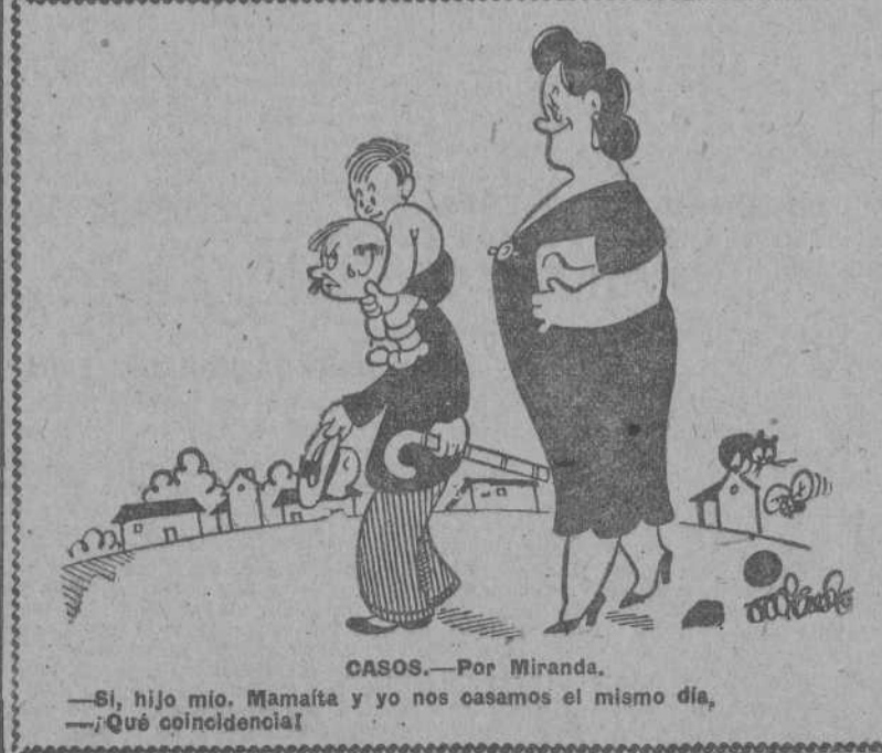
CASOS.—Por Miranda. —Si, hijo mio. Mamaita y yo nos casamos el mismo día. —¿Qué coincidencia!