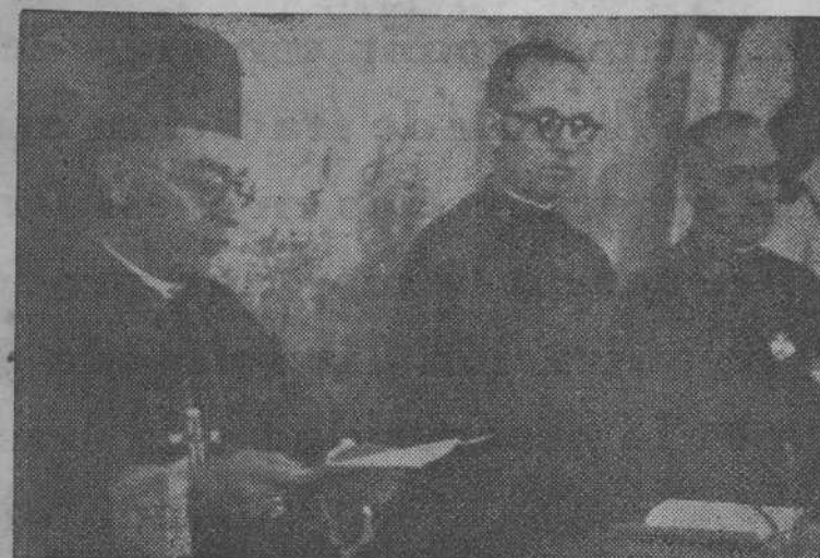
El Sr. Obispo contestando al oferente.