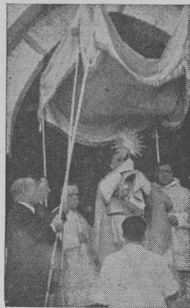
Bendición eucarística del mar a la puerta del templo

Todo ello con espíritu cristiano de mutua comprensión, de emulación recíproca, de afán constructivo. A los pies de la Patrona de nuestros mares y en estos recintos, llenos de idealidad religiosa, se hace la síntesis espiritual de nuestros anhelos y de nuestras diferencias. Todos los hombres de los mares españoles vendremos aquí para consagrarnos a las empresas marítimas de España, unidos por un vínculo sobrenatural y firmísimo de fe religiosa, de esperanzas inmortales y de ambiciones patrióticas.