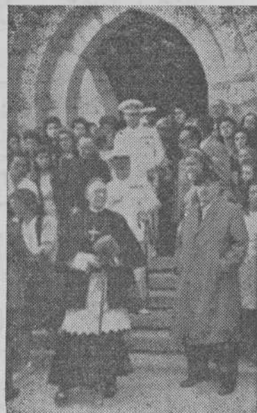
Las autoridades saliendo del templo.

A continuación manifiesta que el ingeniero jefe de las Obras del Puerto de Vigo ha presentado una enmienda.