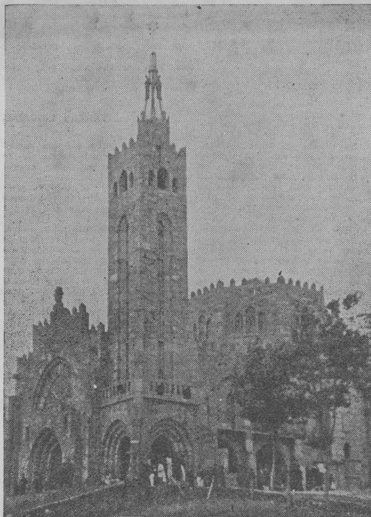
Templo Votivo de Panjón, cuya primera piedra se puso el 11 de mayo de 1931, día en que se quemaban las iglesias de Madrid

Nos haría falta mucho espacio para describir los horizontes y panorama marino en el cual se desenvuelve esta ceremonia indescriptible. Imagínese el lector la ensenada de Bayona, Monterrey, las Estelas, las Cies, y allá lejos, muy lejos, los mares lejanos por donde vinieron a Europa las primeras noticias del mundo descubierto por los españoles.