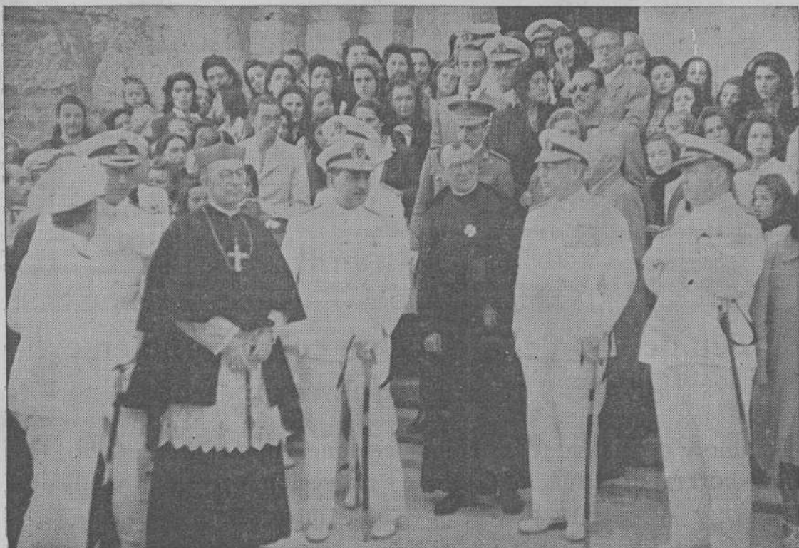
Los ministros de Industria y Marina, Gobernador civil, Obispo de la Diócesis y otras jerarquías, con el párroco de Panjón, a la salida del solemne acto celebrado ayer.—(Foto Bene)

Pero resulta que la industria pesquera en Melilla, incluyendo la conserva y salazón y todos sus elementos, trabaja en un plano de inferioridad con relación al resto nacional, que ha sido quizá la causa y el motivo de mi asistencia en el Congreso Nacional, donde considero una desgracia para Marruecos que se me haya dirigido a mí, por mi modesta perso-