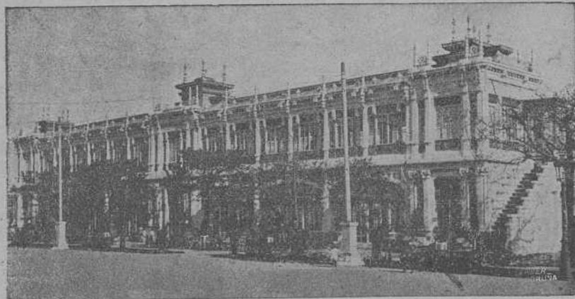
Edificio do «Kiosco Alfonso» - Paseo de Méndez Núñez

Decoraciós pra Teatro en papel especial e tela con duas ou mais transformaciós -- Especialidade en asuntos e paisaxes gallegos -- Decoraciós pra Teatros pequenos e salós familiares -- Pantalias especiaes pra Cine -- Construcción de Carrozas e Arcadas para festas Traballos de propaganda -- Restauración e decoración d'Altars e imáxines Construcción de Monumentos de Semana Santa -- Paneaus decorativos e decorado de Salós en todos estilos, ao óleo y ao temple--Imitación de tapices con asuntos de pinturas antiguas e modernas :-: PREZOS ECONOMICOS