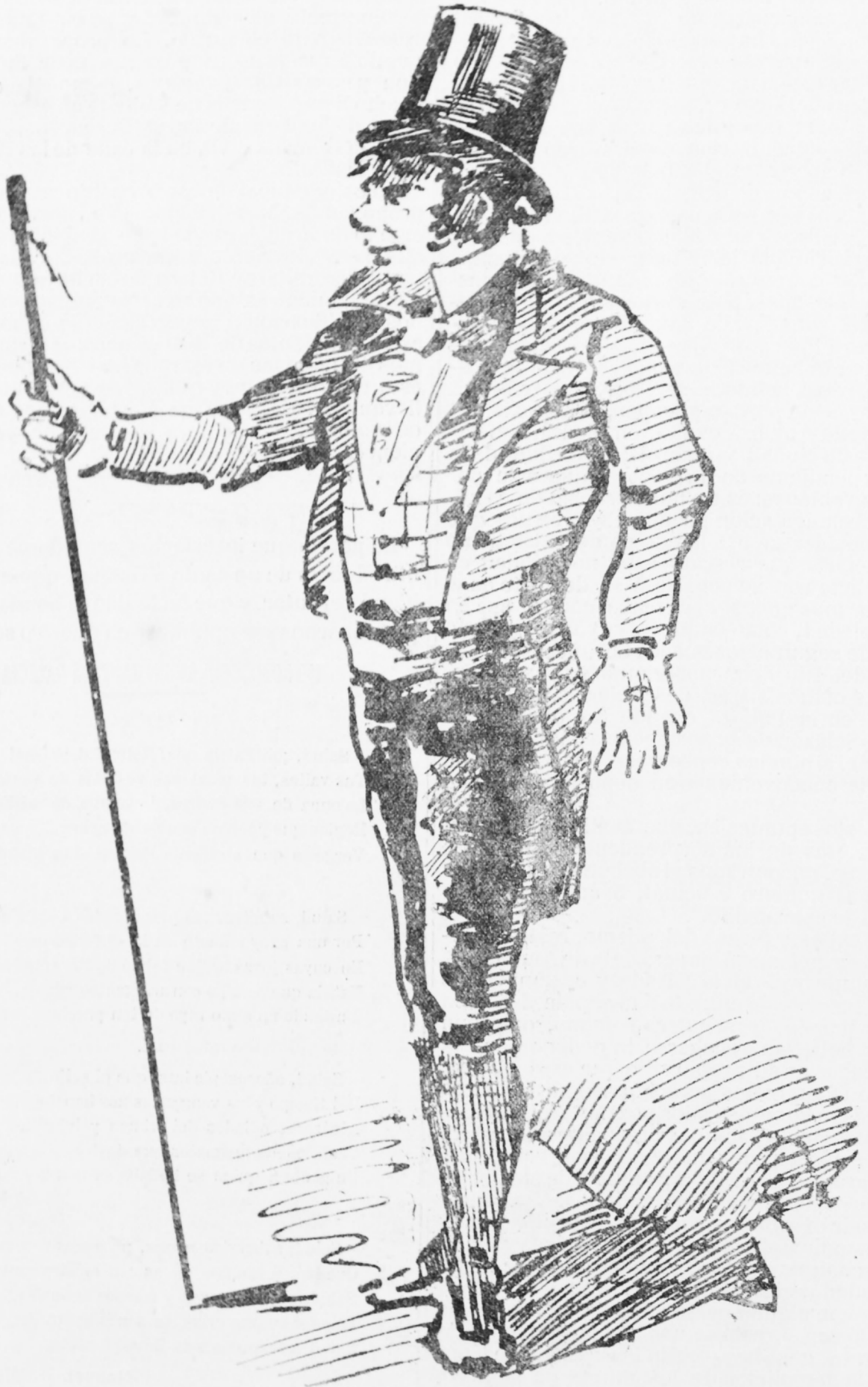
Señor Alcalde mayor no prenda V. á los ladrones,