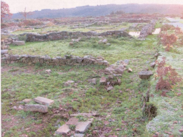
Área escavada denantes realizar a limpeza biológica