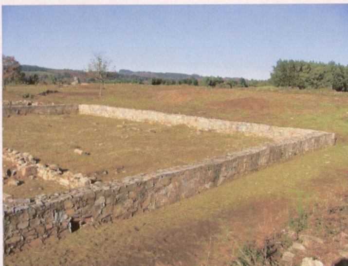
Campamento rematada a limpeza

A handwritten signature or mark in dark ink, consisting of a series of loops and a long horizontal stroke extending to the right.