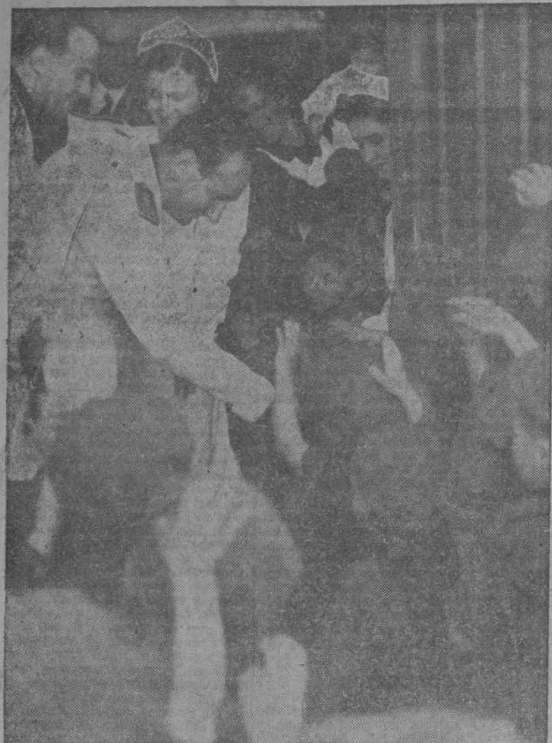
ALMERIA.—El ministro secretario general del Partido, camarada Arrese, inauguró en Barja el Hogar "José Antonio", de Auxilio Social.