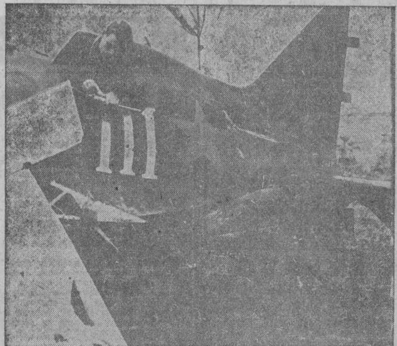
En un avión ruso, derribado delante de San Petersburgo, se ha acomodado este dibujante alemán para trabajar.