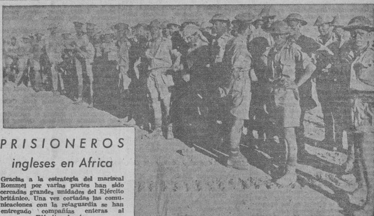
PRISIONEROS ingleses en Africa

Era la expedición más fuertemente protegida que enviaban los anglosajones a la U. R. S. S.