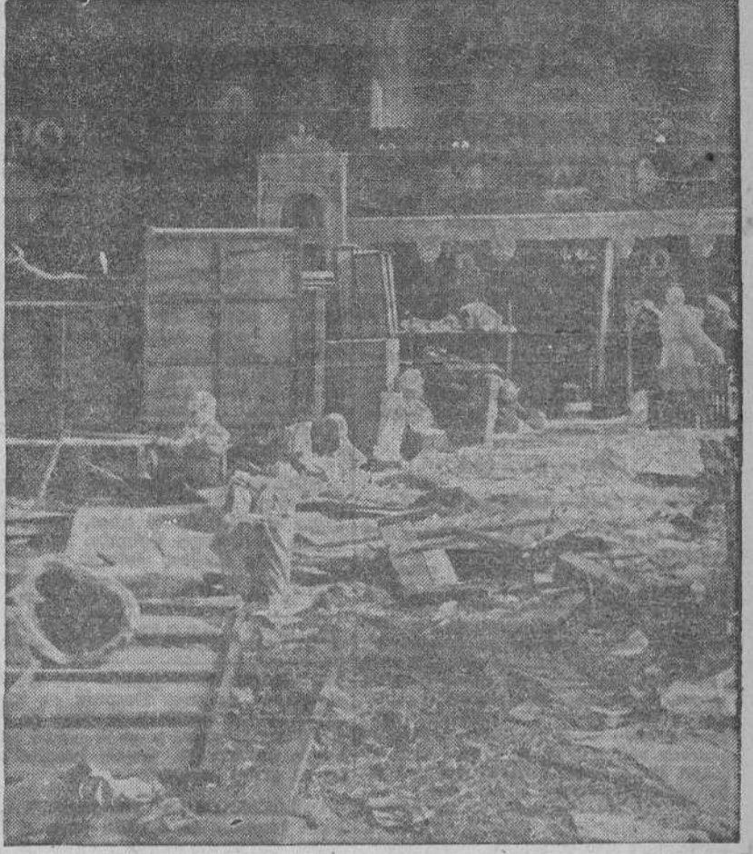
LA VIDA RELIGIOSA HA VUELTO A LA UCRANIA Aspecto del interior de una iglesia ucraniana de las tantas que han sido destruidas por los Soviets. El Altar Mayor de esta iglesia fué utilizado para poner carteles de propaganda antireligiosa, la mayoría de las figuras de cera fueron también destruidas. Esta foto da perfecta cuenta del estado en que dejaron los Soviets las iglesias