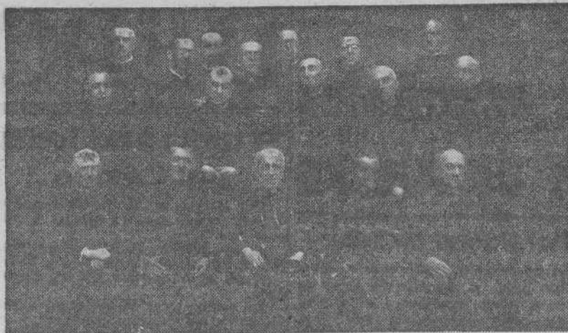
SANTIAGO. Grupo de sacerdotes pertenecientes a la promoción de 1917, que han celebrado sus bodas de plata con el sacerdocio, reunidos con el Excmo. Sr. Arzobispo de Santiago