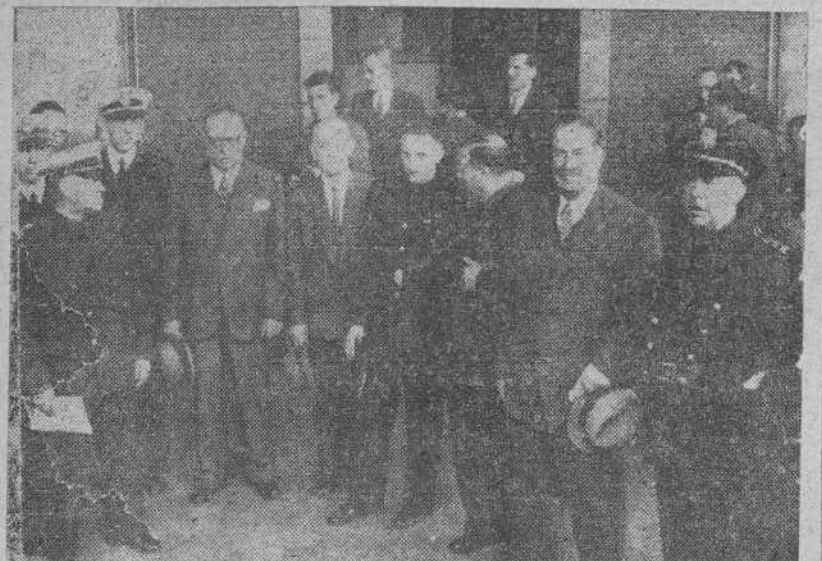
El Excmo. señor Director General de Aduanas, al llegar a La Coruña, acompañado de las autoridades y jerarquías que acudieron a recibirle.