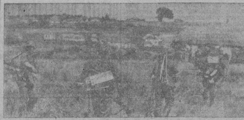
Soldados de la infantería alemana se acercan cautelosamente a este pueblo ruso, donde tendrá que ser combatida casa por casa. Principalmente tienen que defenderse contra la astucia de los soviets.