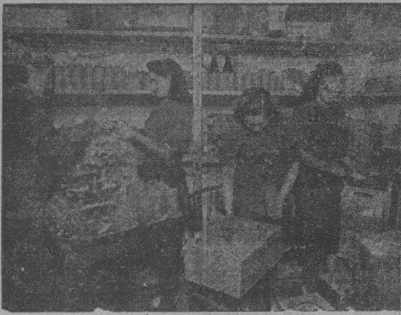
Camaradas de la Sección Femenina de FET y de las JONS, empaquetando harina especial, para distribuir entre las madres necesitadas.