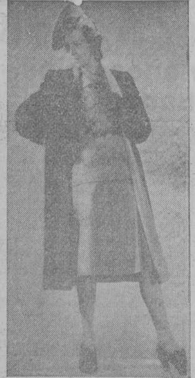
Los primeros modelos para el invierno, en Berlín

Ejercicio oral.—Se convoca para mañana, a las cuatro de la tarde, a los alumnos comprendidos entre el número 307 al 353, ambos inclusive.