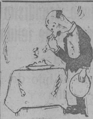
LA ENSALADILLA RUSA

de nuevo, y muy pronto, como jugador titular de un "primera división". ¡Adios, noy!—OLIMPIO.