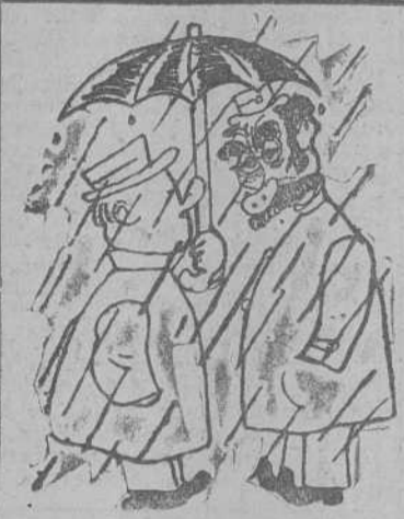
UN ILUSO, por Galindo —¿Y a usted no le asusta este tiempo? —No señor. Yo a mal tiempo buena cara.

Por Galindo —Da señales de estar descompuesta.