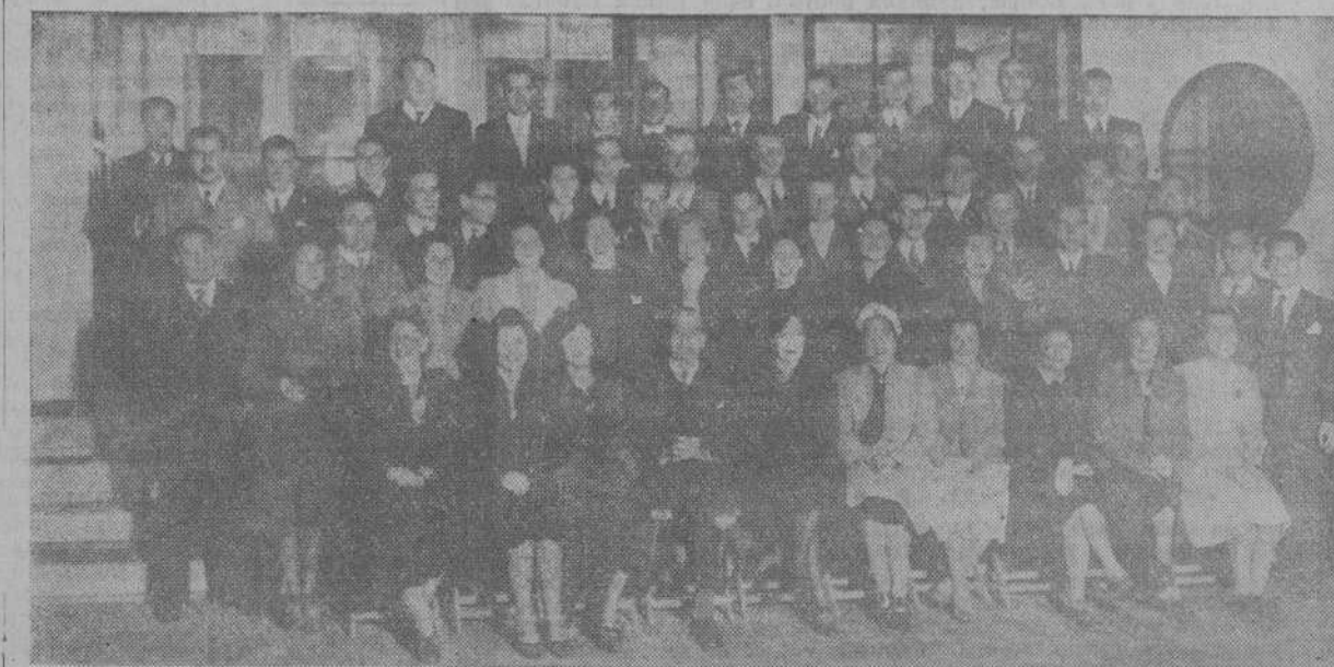
Los componentes de la notable agrupación polifónica El Eco que ayer fueron agasajados por la Directiva de la citada Sociedad con un vino de honor, con motivo de los recientes éxitos de dicha agrupación musical. (Foto EL IDEAL GALLEGU).

Desde Amiens informan al mismo periódico que la aviación inglesa efectuó ayer una incursión contra la ciudad, y que una mujer resultó gravemente herida.—(EFE).