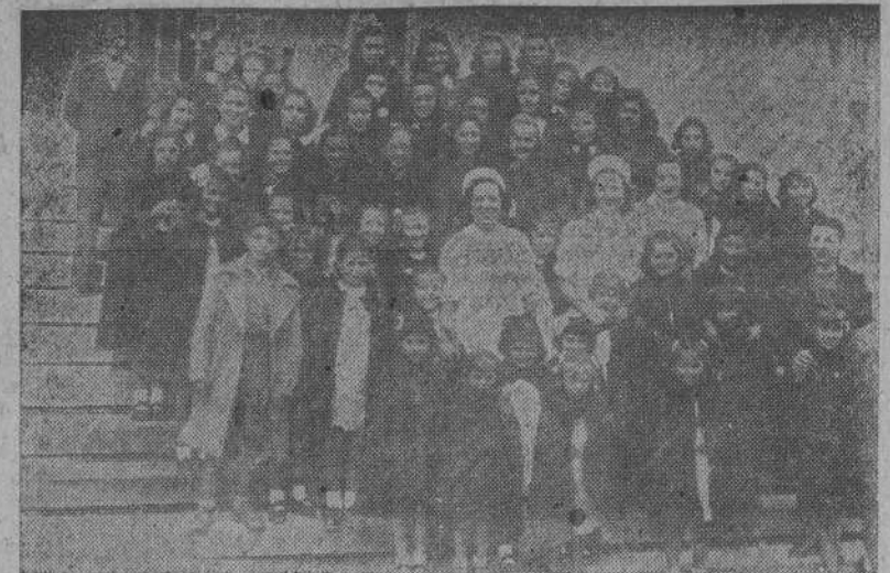
Niñas beneficiarias de Auxilio Social, pertenecientes al Hogar Infantil de Las Jubias que concurren a la misa celebrada en San Pedro de Mezonzo